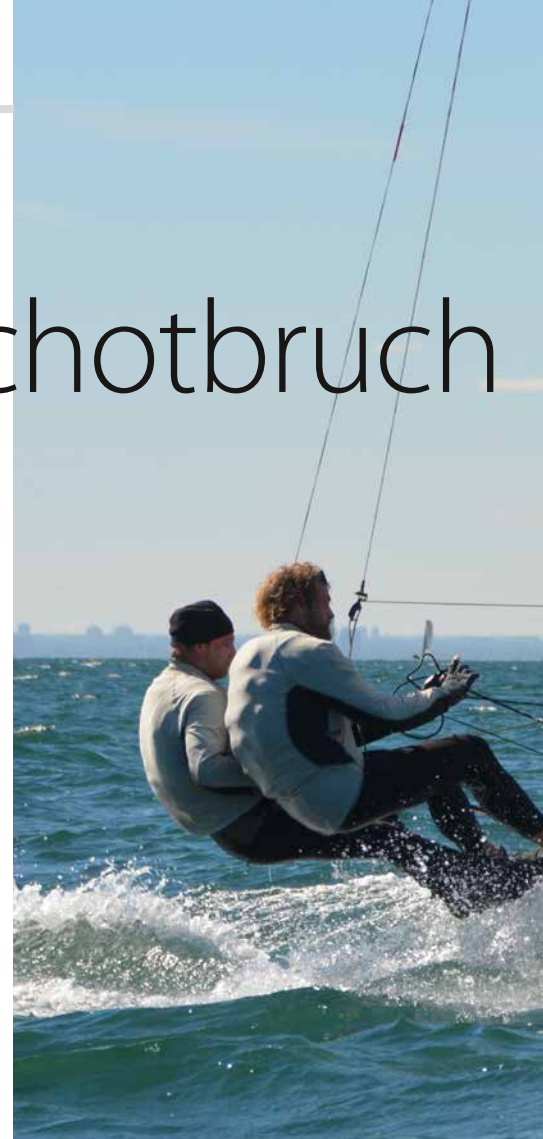
Bild 1: Segelrennjolle der International 14 Class mit optimiertem Großbaum in Aktion.

Im ersten Schritt, der Sensitivitätsanalyse, werden die Design- (Input-Parameter) und